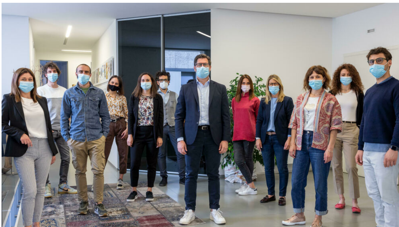
Lo staff di Fkdesign

L'agenzia di comunicazione di Castelfranco Veneto, risultante tra i finalisti il mese scorso, ha ottenuto da Le Fonti Awards l'ambito riconoscimento che celebra le migliori realtà imprenditoriali nel panorama italiano