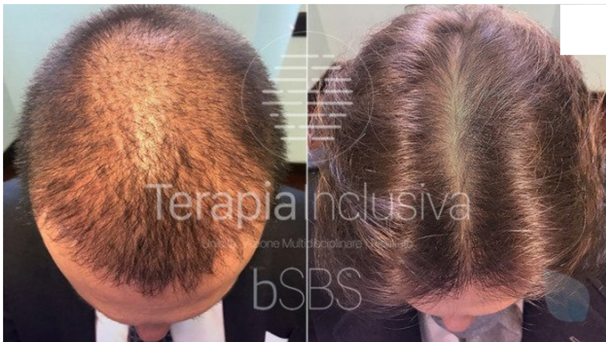
Le Fonti Awards, Hairclinic premiata per innovazione