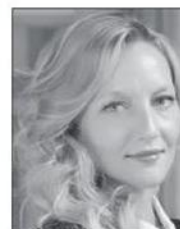
Valentina Canalini Gianni Origoni Grippe Cappelli & Partners