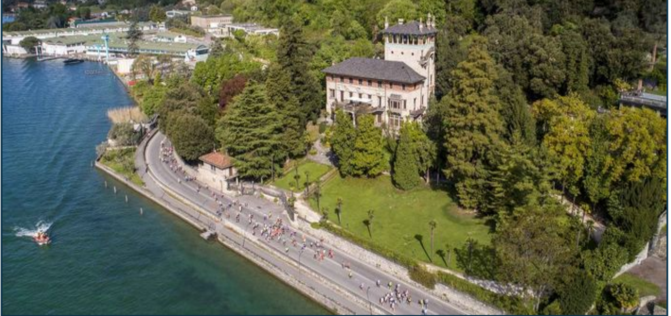
Sarnico Lovere Run