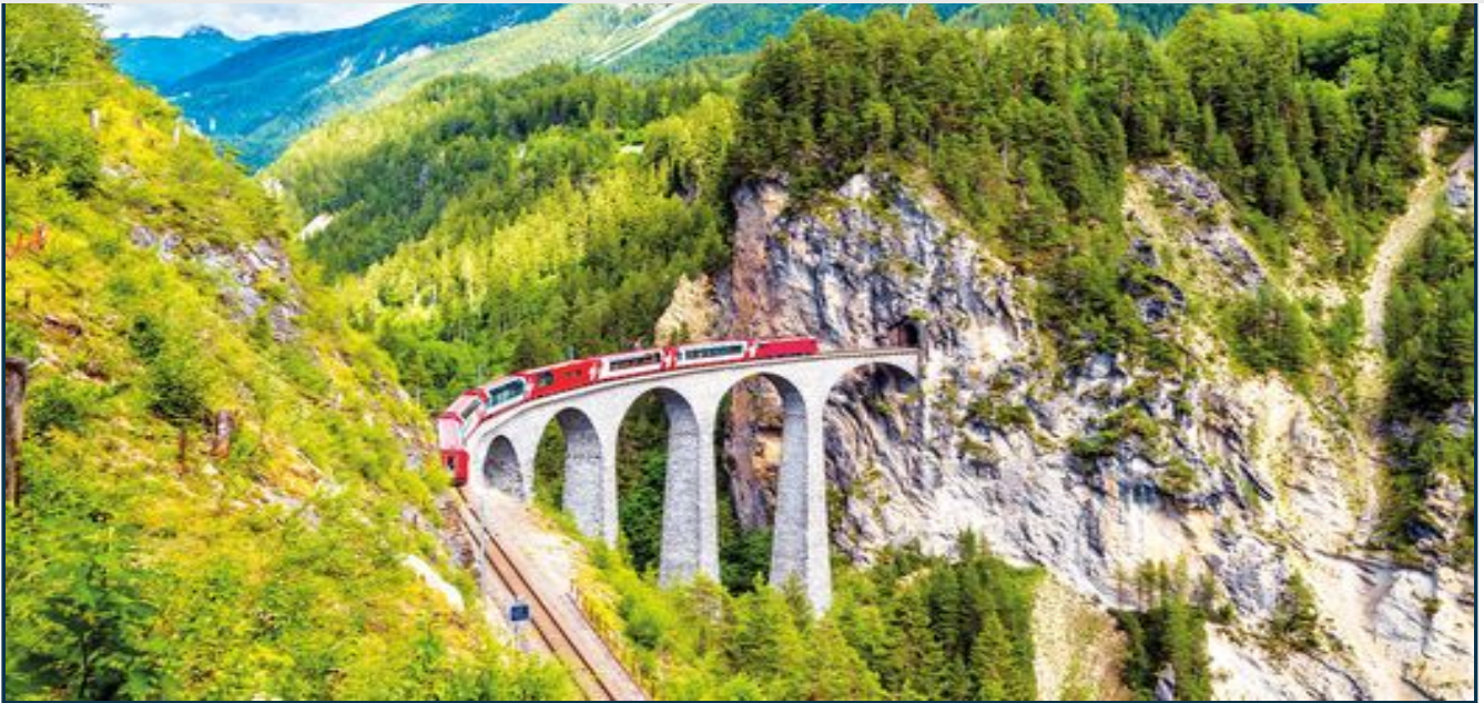
Sul Trenino Rosso con Slow Lombardia Experience