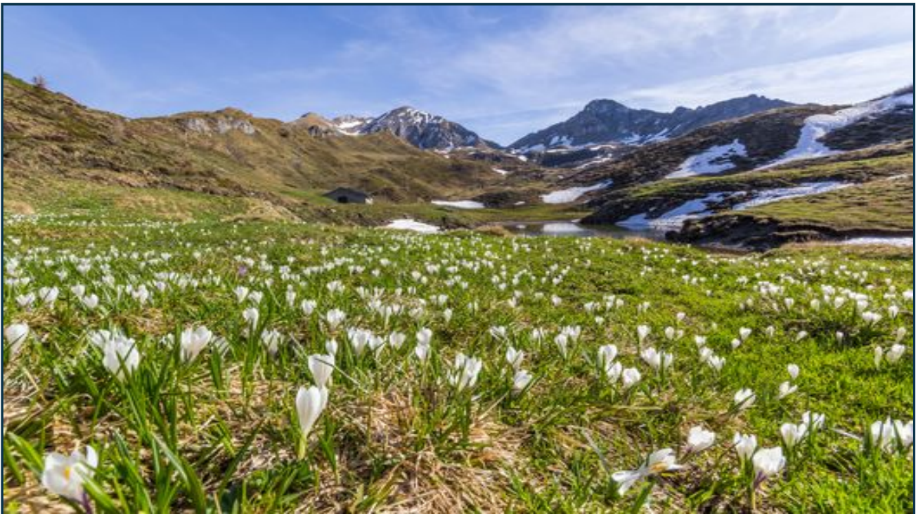
Orobie di aprile. Tanto amore lombardo